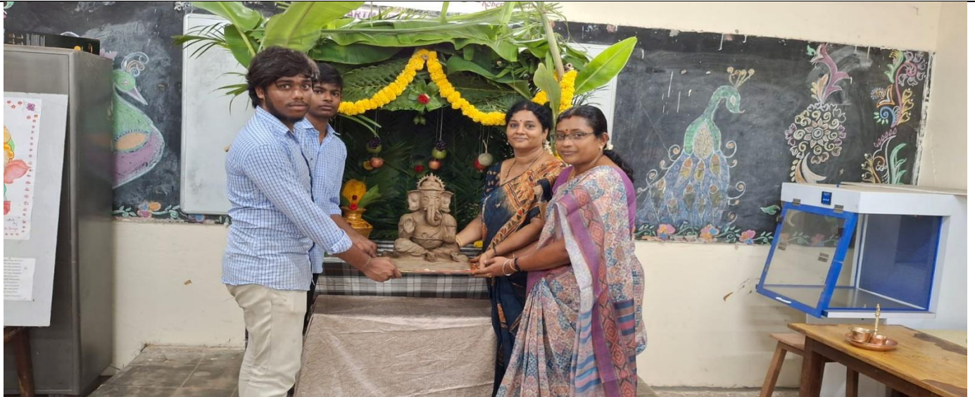
Selling of Vinayaka Pathri by Students