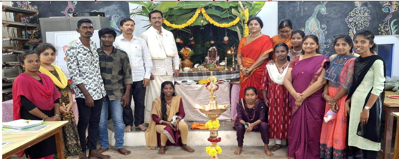
Second year students participated in preparation og Mud Ganesha